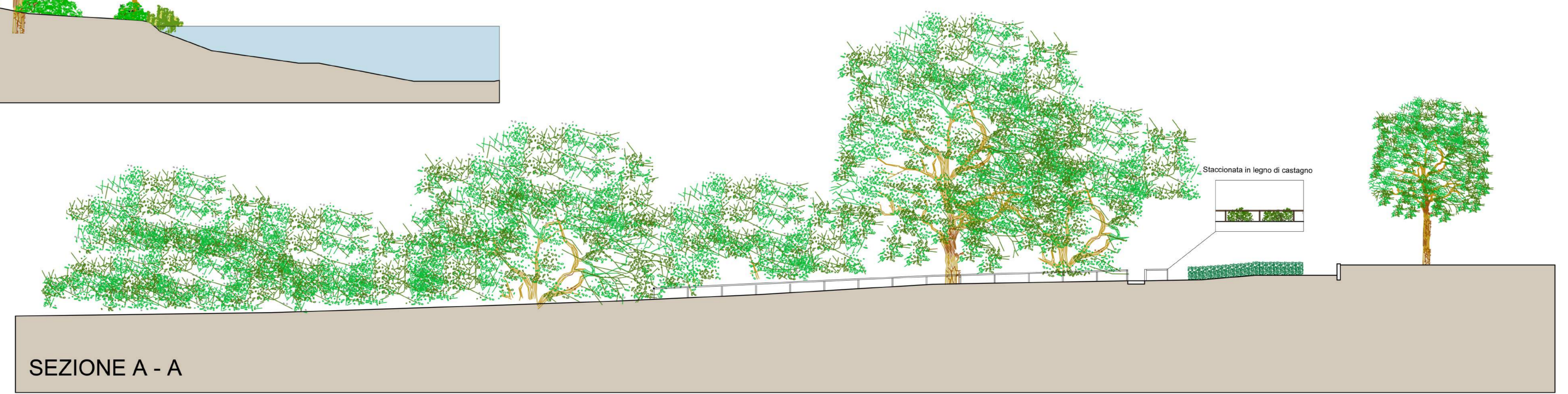
SEZIONE A - A