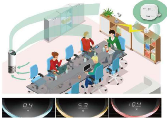
きれい やや汚れている 非常に汚れている

空気清浄機から離れた場所の汚染物質を測定し、空気清浄機本体に通知することで、部屋全体にクリーンな空気を行き渡らせます。