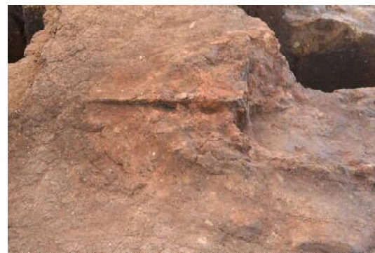
竪穴住居跡 SI-10 カマド（北から）