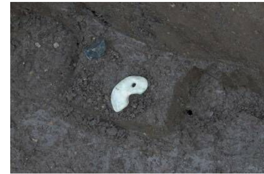
装身具出土状況（西から）