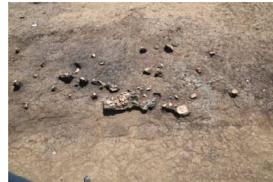
土器集中部（北から）

調査区西半から弥生時代中期後半の土器（宮ノ台式）が集中して出土しました。当初、竪穴住居跡を想定して調査を進めていましたが、明確に住居としての痕跡を確認することができませんでした。土器集中部より少し南に離れた包含層から石製品（装身具）が出土しています。