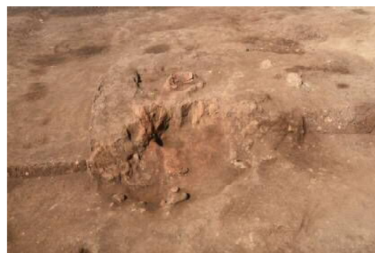
竪穴住居跡 SI-4 カマド（東から）