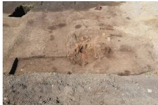
竪穴住居跡 SI-4（東から）

規模は残存地で東西330cm×南北280cm、深さ10cmを測ります。住居の南側と西側は後世に削平を受けて消失しています。調査の結果、住居の東端にカマドが造られていることが判明しました。土器の時期から奈良・平安時代の遺構であることが解ります。