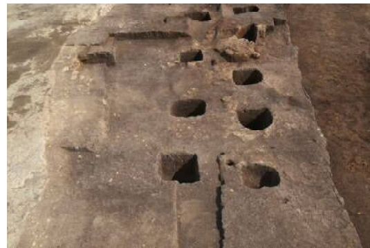
竪穴住居跡 SI-10（西から）