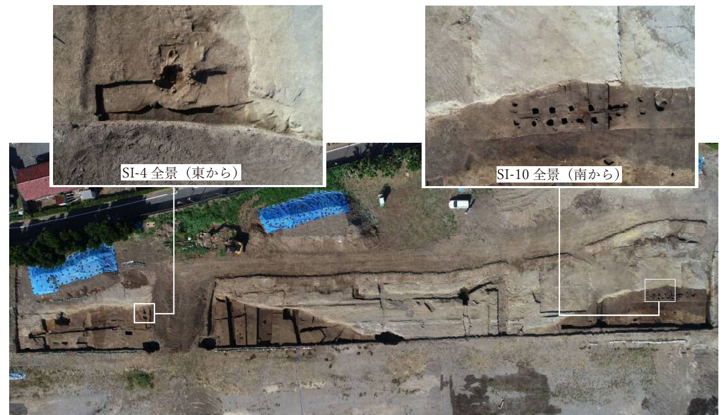
陣出遺跡空中写真（上が北）