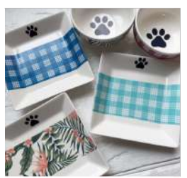
ASHE BLUE & MOMO Ocean Design