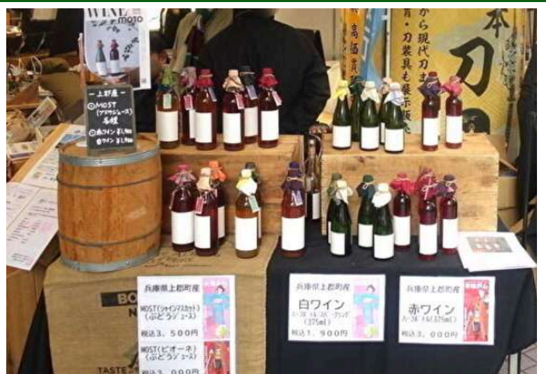
「兵庫と出会う～五国マルシェ～」