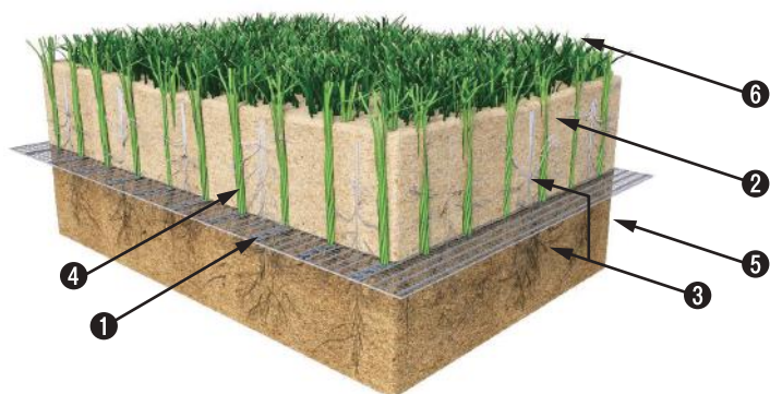
①基布 ②珪砂充填材 ③天然芝の根 ④人工ファイバー ⑤トップの土壌 ⑥天然芝