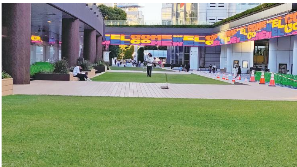
クリスタルアベニュー 芝生広場

2023年、東京ドームシティにハイブリッド芝生の広場が誕生しました！ 芝生の上を自由に歩いたり、遊ぶことができます。