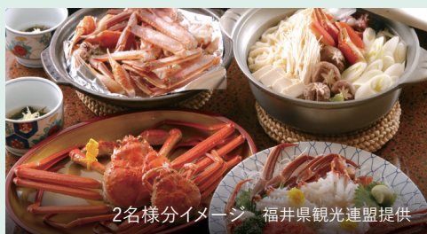
2名様分イメージ