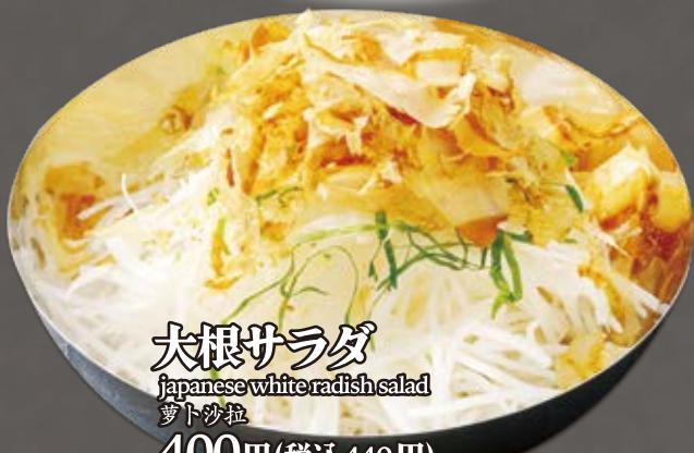
大根サラダ japanese white radish salad 萝卜沙拉 400円(税込440円)