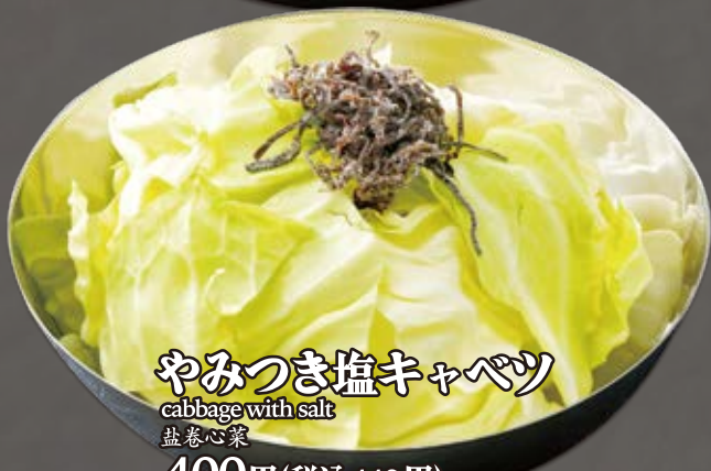
やみつき塩キャベツ cabbage with salt 盐卷心菜 400円(税込440円)