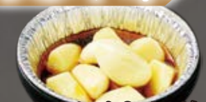
んにくオイル焼 garlic 锡箔烤大蒜 500円(税込550円)