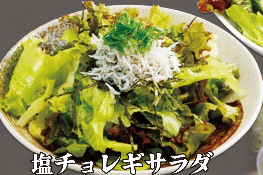
塩チョレギサラダ korean salt salad 韩式盐蔬菜沙拉 600円(税込660円)