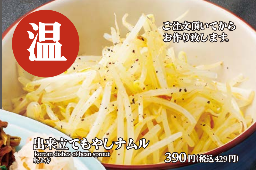
出来立てもやしナムル korean dishes of bean sprout 腌豆芽