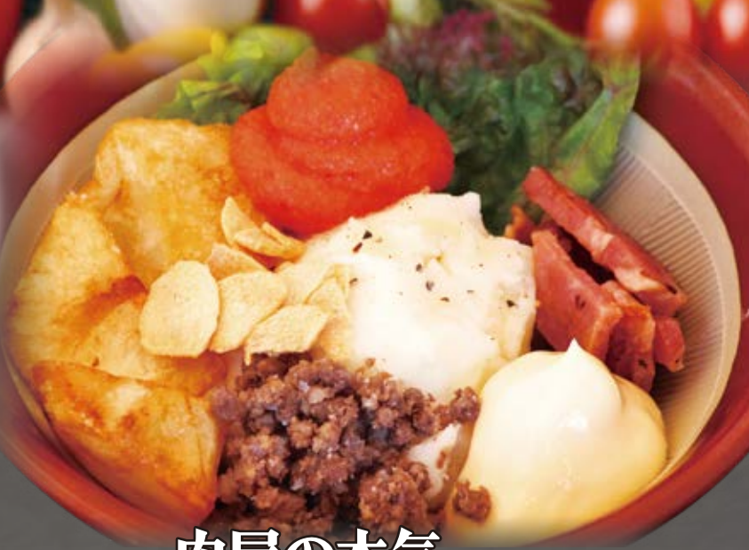
肉屋の本気 明太ポテトサラダ mentaiko potato salad 明太子土豆沙拉 630円(税込693円)