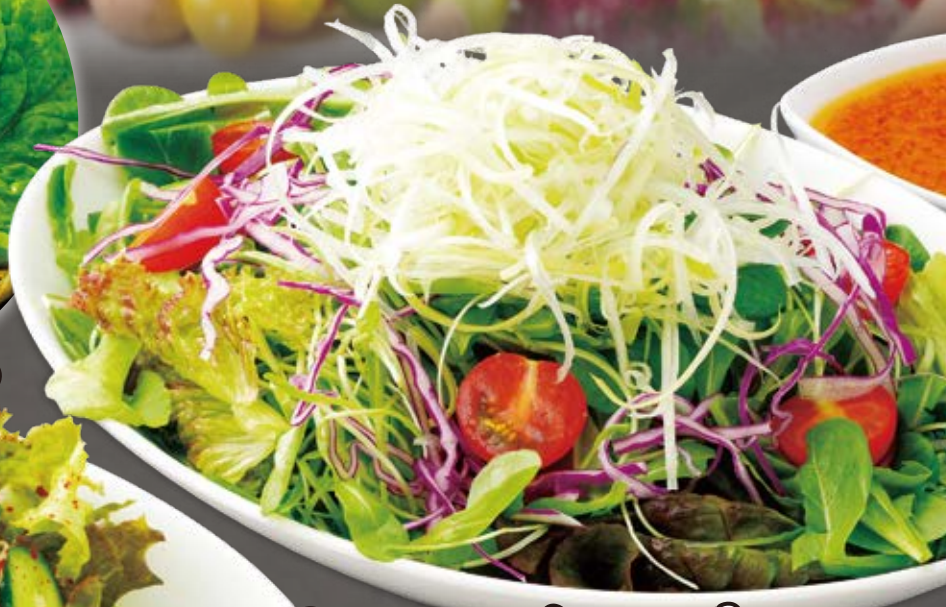
よしのサラダ yoshino salad yoshino沙拉 700円(税込770円)