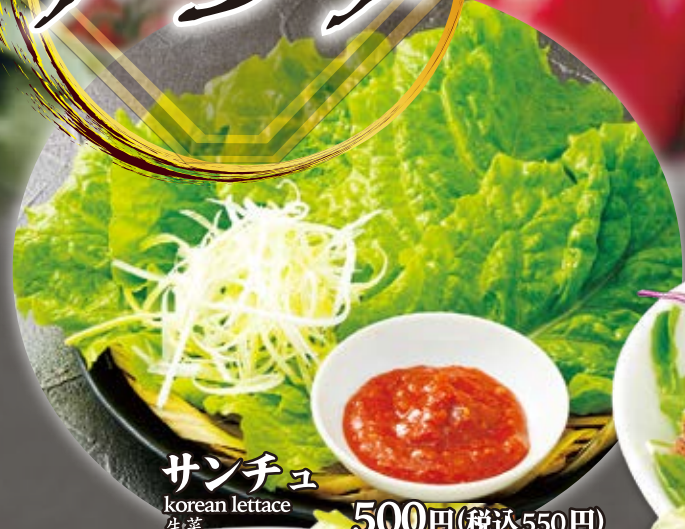
サンチュ korean lettuce 生菜 500円(税込550円)