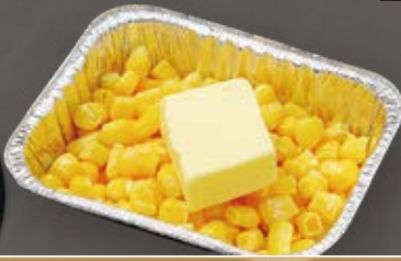
たっぷり コーンバター corn buttercorn butter 玉米黄油 350円(税込383円)