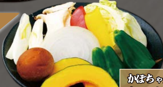
きのこ野菜盛り vegetable combination platter 蘑菇蔬菜拼盘 720円(税込792円)