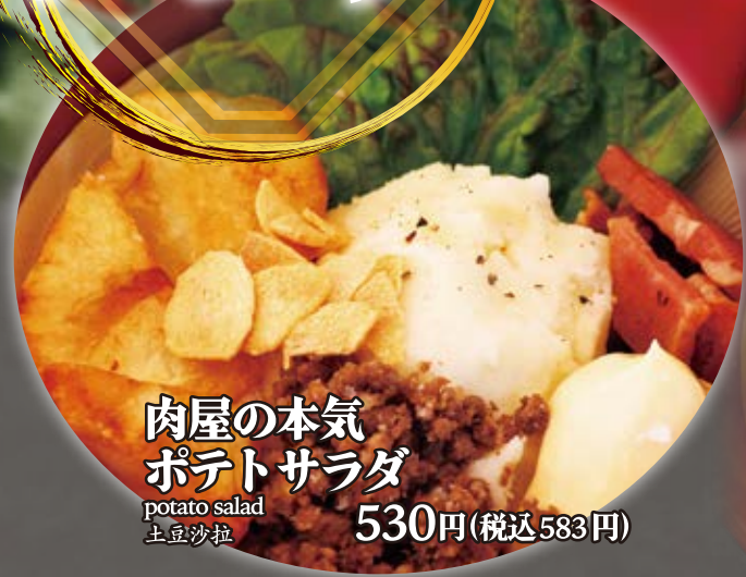
肉屋の本気 ポテトサラダ potato salad 土豆沙拉 530円(税込583円)