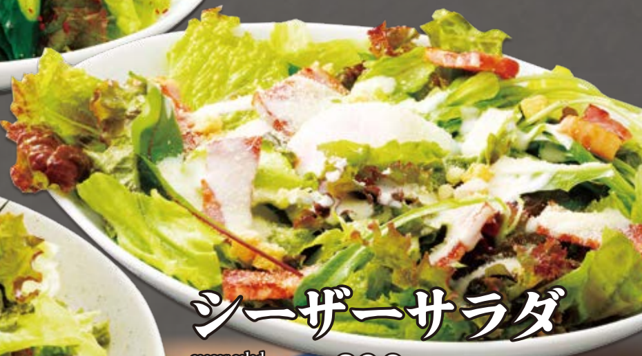
シーザーサラダ caesar salad 凯撒沙拉 820円(税込902円)