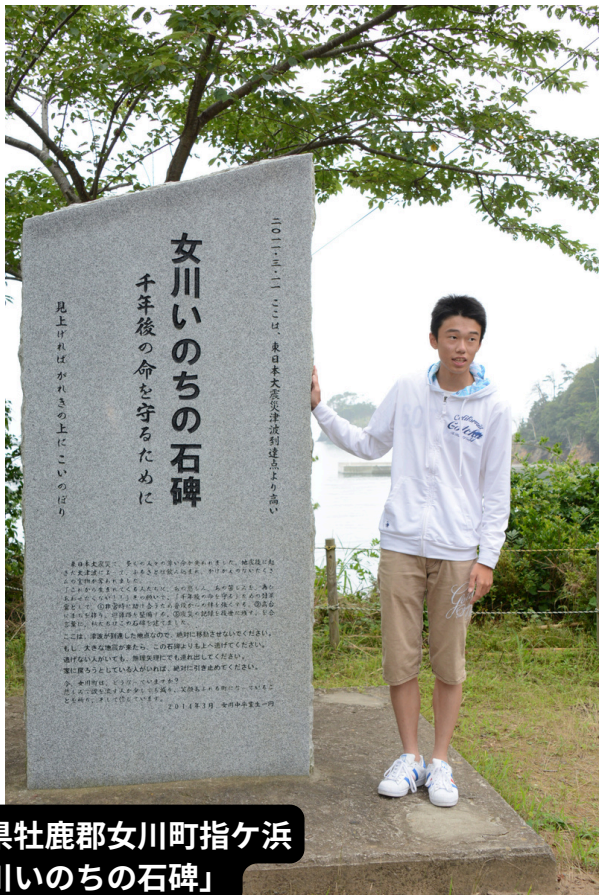
宮城県牡鹿郡女川町指ヶ浜 「女川いのちの石碑」