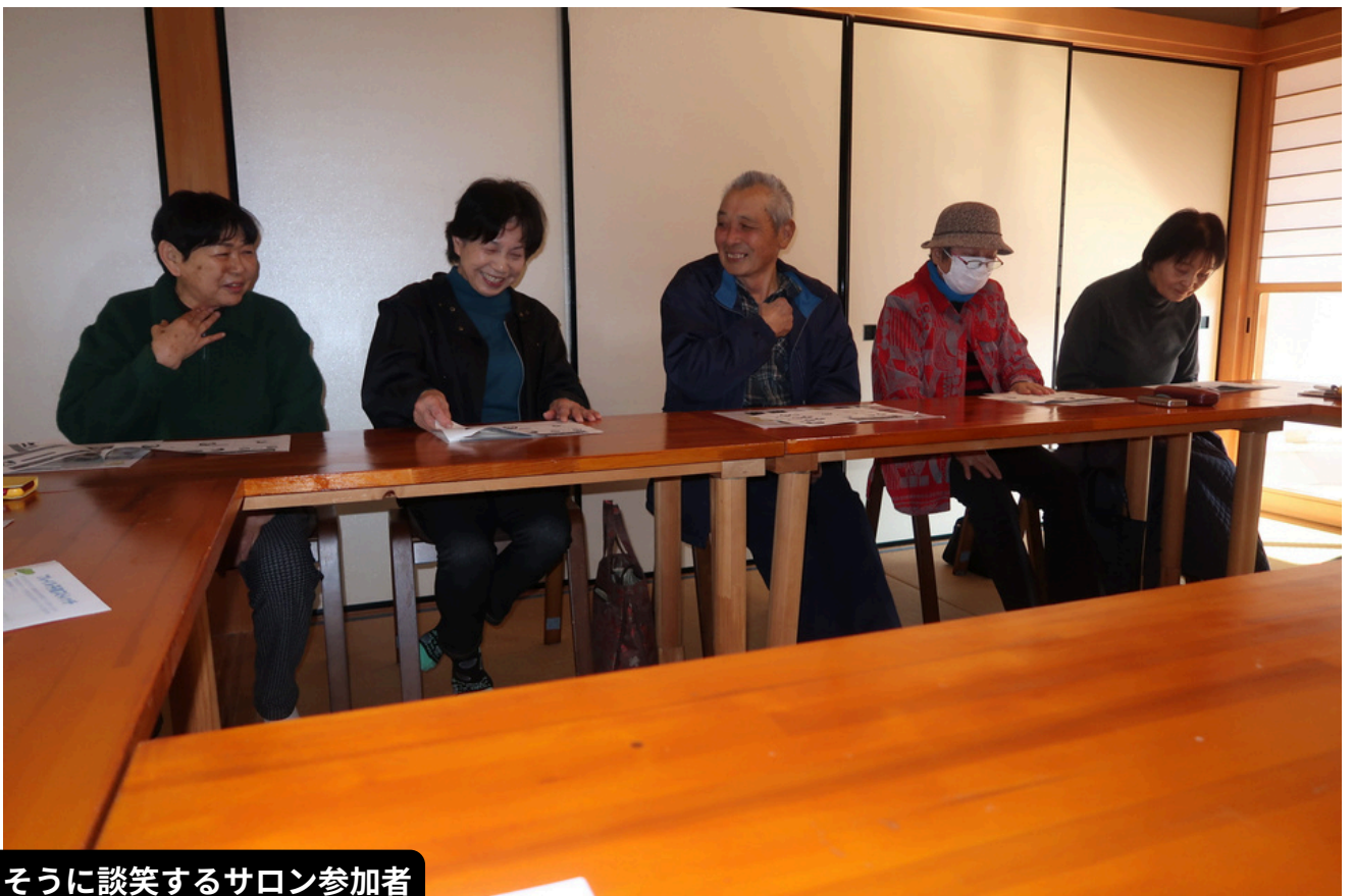
楽しそうに談笑するサロン参加者