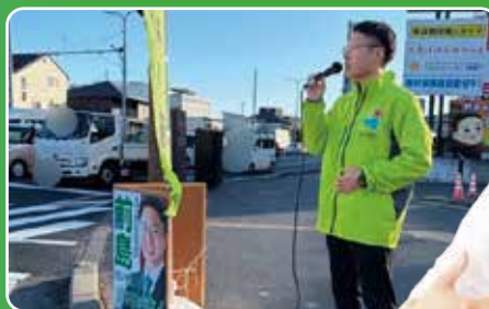
定期的に街頭演説を行っています！