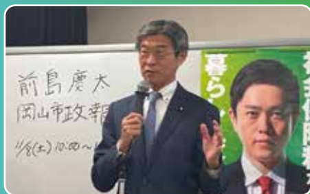
2026年も様々なイベントを企画していきます！