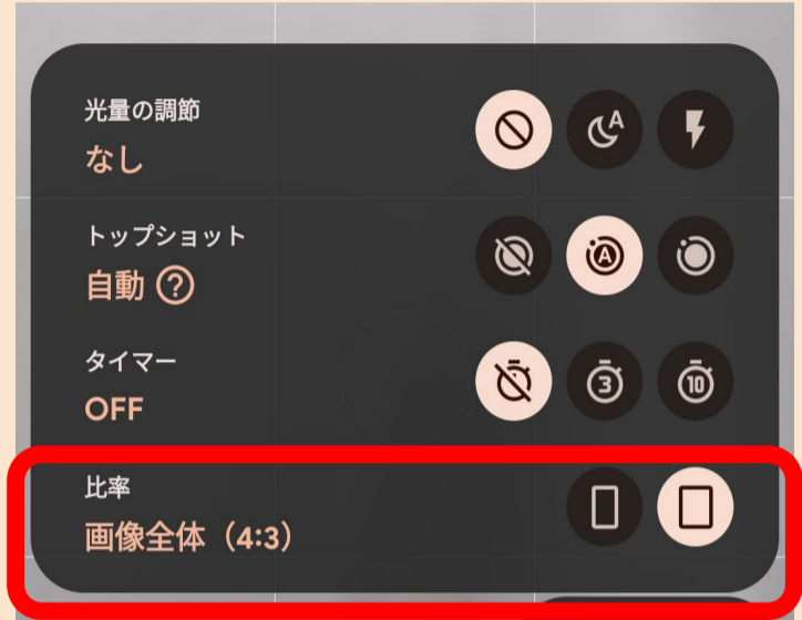
※ Google Pixel 7aのカメラアプリ設定画面 (端末によって設定画面は異なります)