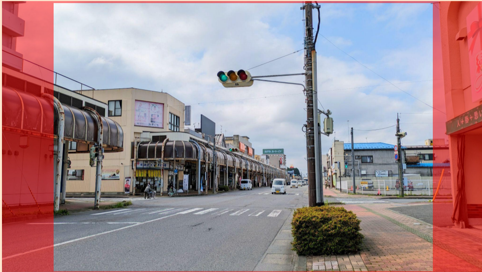
→切り取られる範囲

一部スマートフォン(比率が16:9などのワイドに設定された端末)で撮影されたお写真を「L版」などの「2:3」比率のサイズでプリントすると、 上下左右が大きく切り取られてしまう場合 がございます。カメラアプリの設定で比率設定を「4:3」または「3:2」に変更することをご検討ください。