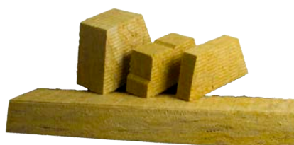
Steenwol Vulblokken & Cannelurevulling