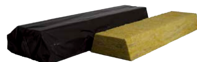
Steenwol Cannelurevulling (gesealed)