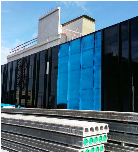
Bescherming van: Aluminium profielen en glas in gordijngevels.

Deze milieuvriendelijke, vloeibare beschermfolie is ontworpen om alle kwetsbare materialen te beschermen tegen beschadiging en/of verwerking. Wordt aangebracht met airless spuittoestel, borstel of roller en is gemakkelijk met de hand te verwijderen.