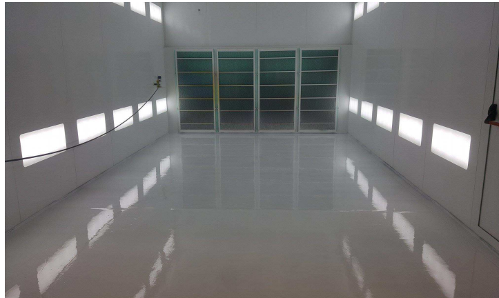
Bescherming van: Vloeren en wanden in spuitcabines.