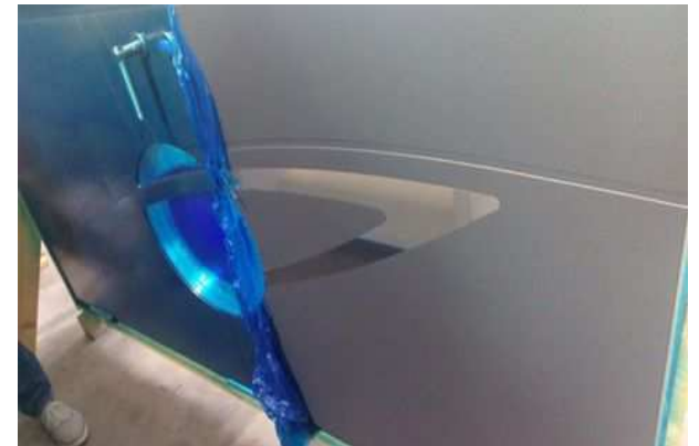
Bescherming van: Gepoederlakte sierpanelen.