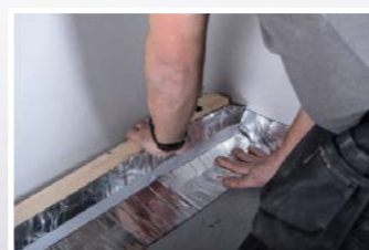
Flexibel luftfördelningsprofil förenklar installationen.