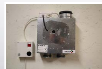
Lämplig placering för fläkten är vind, förråd, pannrum, tvättstuga eller liknande.