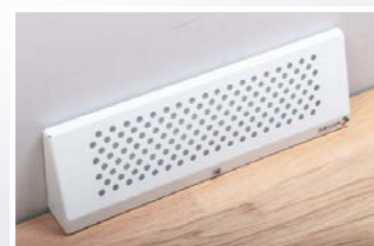
Golvdon i stilren design för alla miljöer.