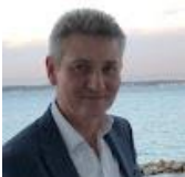
IT Specialist – Office365 – Backup - Sikkerhed

Kontakte os og få et tilbud på netop jeres løsning.