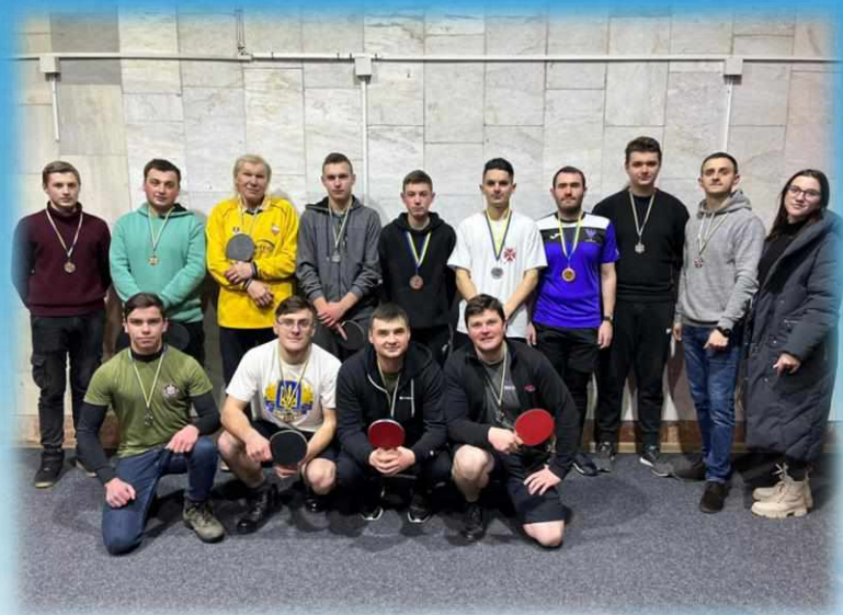
благодійний турнір з настільного тенісу до Дня святого Миколая.

Зібрані кошти були долучені до придбання 7 автомобілів, газового примусу, пального, шин та інших запчастин до автомобілів, генераторів, палива для доставки гуманітарної допомоги на передову, тактичного взуття, флісової тканини та продуктів для випічки.