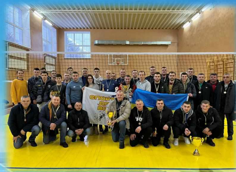
Турнір «Покоління», присвячений Дню Збройних Сил України