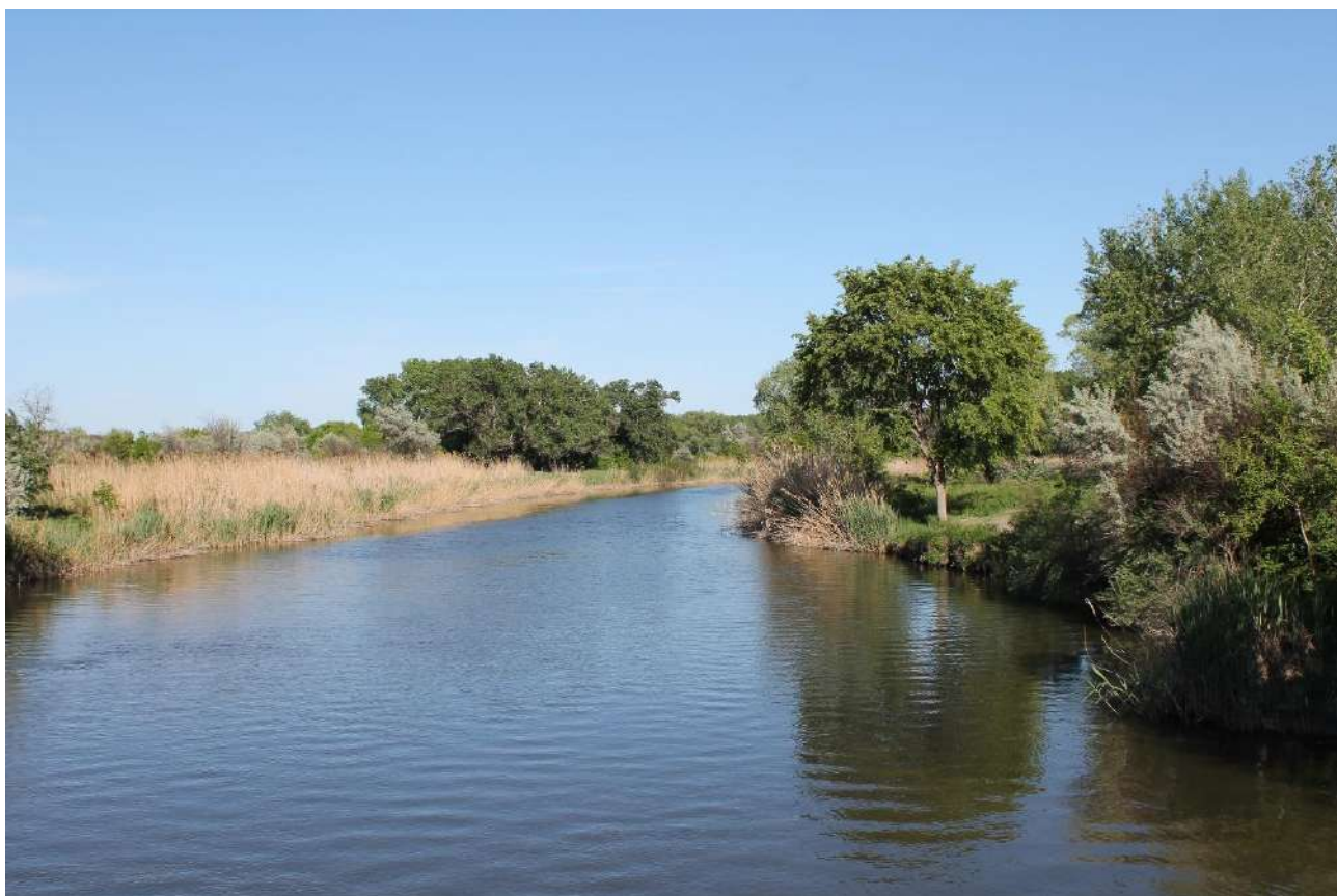
Мал. 1. Річка Айдар в межах Щастинської територіальної громади

Ріка Айдар – річка Луганській області України, ліва притока Сіверського Дінця. Довжина 256 км. Площа водозбірного басейну 7370 км 2 . Похил річки 0,34 м/км. Долина завширшки у верхів'ї 2-5 км, у пониззі – до 6 км. Схили долини розчленовані ярами та балками. Річище завширшки до 50 м, розчищене протягом близько 20 км. На значній протяжності являє собою чергування плесів (завглибшки 4 – 7 м) та мілководних перекатів (завглибшки 0,2 0,4 м). Живлення снігове і ґрунтове. На весняний період припадає 70 % стоку. Середній модуль стоку 1,7 л•сек/км 2 . Скресав на початку березня, замерзає в грудні.