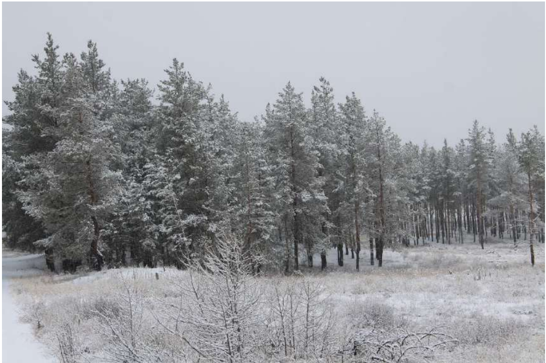
Мал. 2. Ліс на території Щастинської міської територіальної громади

Військові дії на території громади призвели до колосального знищення сотні гектарів хвойних насаджень, погіршуючи складну екологічну ситуацію регіону. Відтворення лісів в умовах сухого степу та клімату, що не сприяє їх зростанню, провести дуже складно, заходи потребують значних затрат як трудових, так і матеріальних ресурсів.