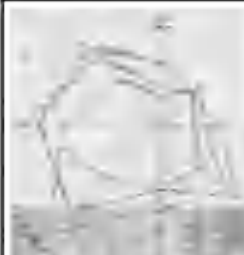
Відомості координат червоних ліній Державна система координат