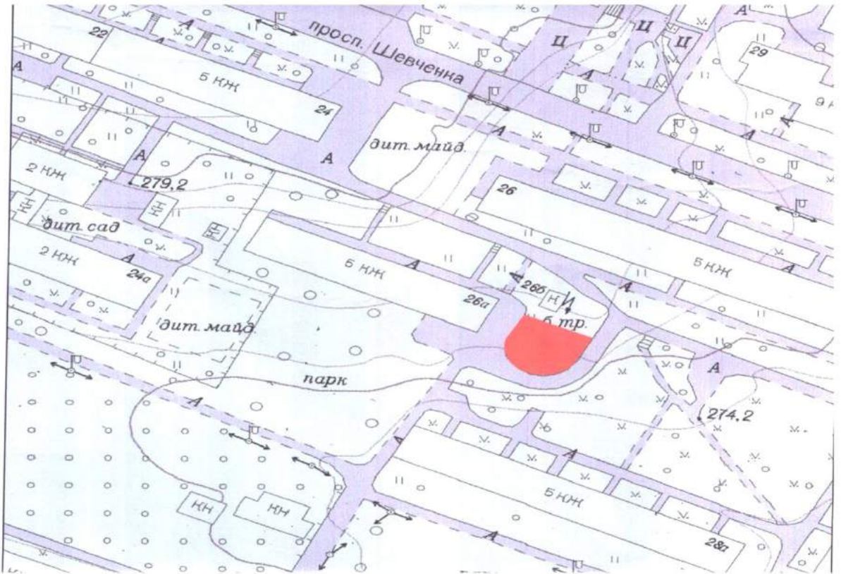
Схема розміщення збірно – розбірного гаража