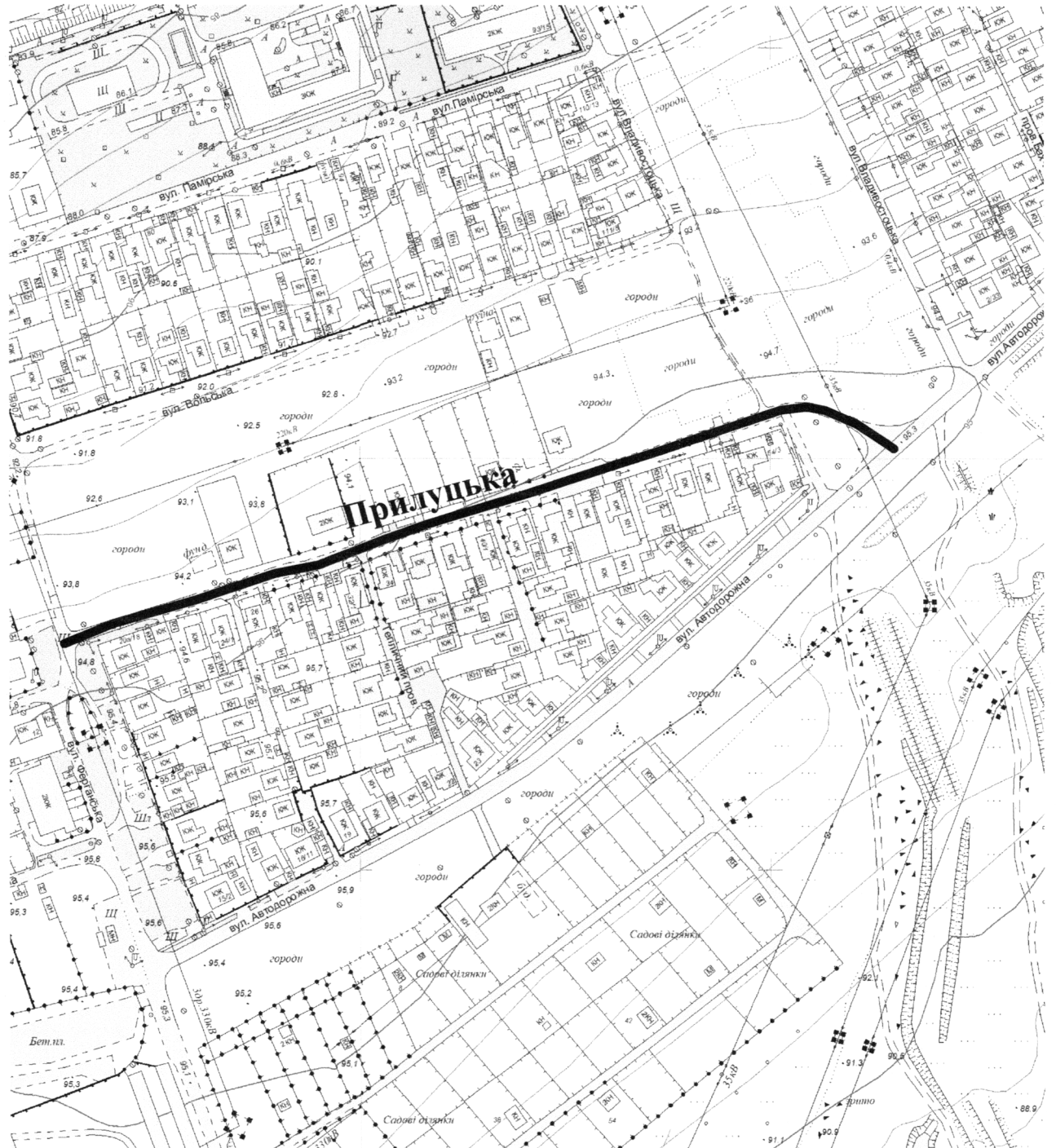
СХЕМА розташування вулиці Прилуцької М 1:2000