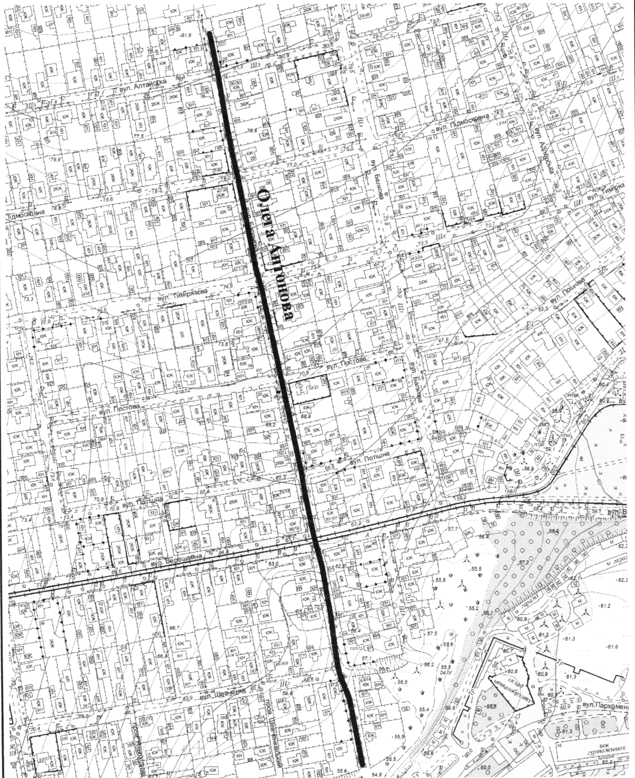
СХЕМА розташування вулиці Олега Антонова М 1:2000