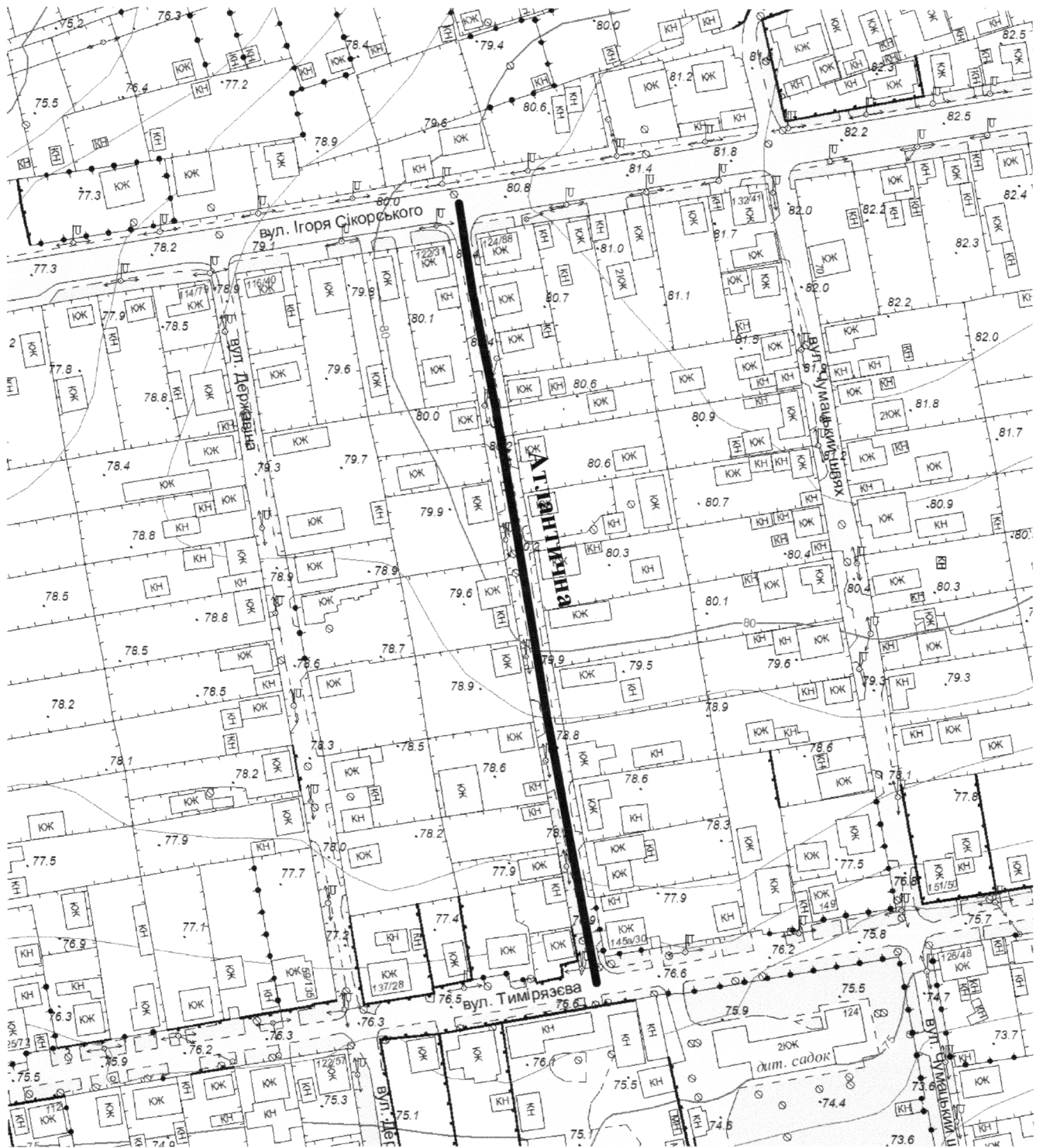
СХЕМА розташування вулиці Атлантичної М 1:2000