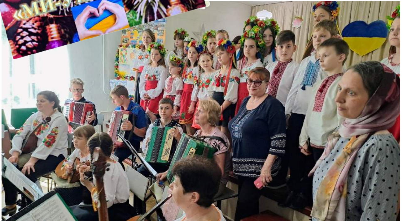
Звітний концерт відділу народних інструментів «Ми-українці»