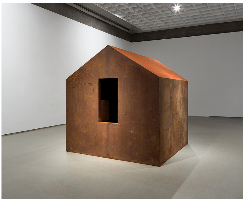
מיכה אולמן, חצות, מהסדרה "מכלים", 1988