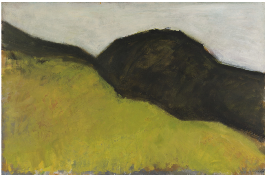
אורי רייזמן, מף, שנות ה-70