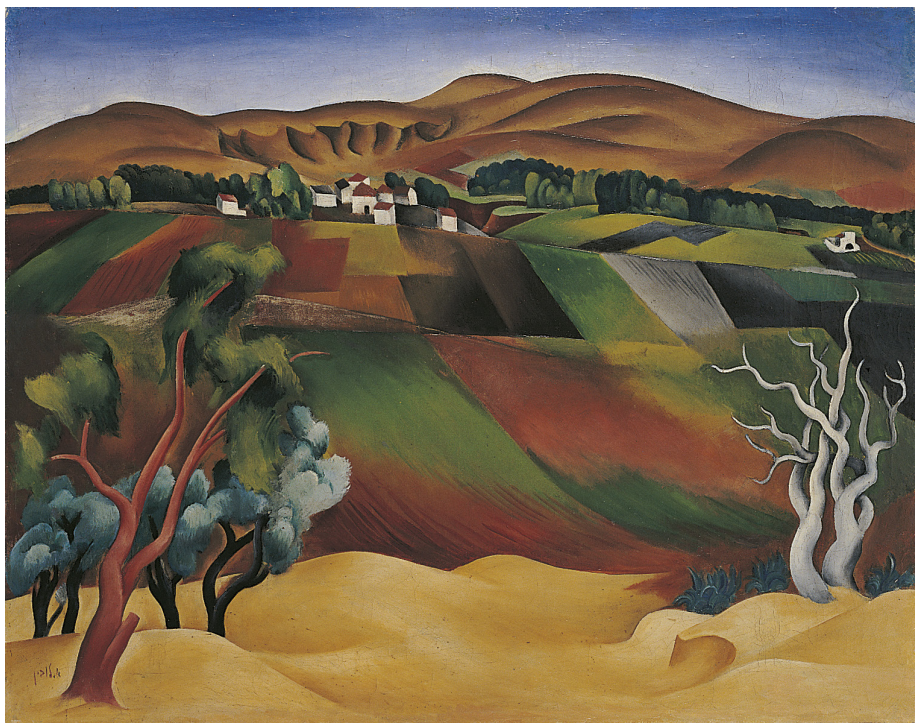
אריה לובין, פראה פתל אביב לנבעות רפת, 1969