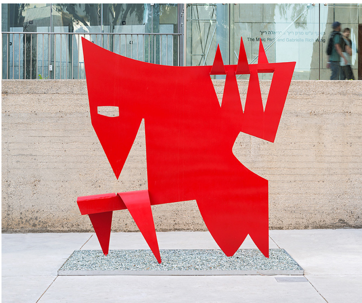
דב פייגין, חיה, 1958

הפסל חיה, שטוח ונראה כמו מגזרת נייר. אך למעשה הוא עשוי לוחות נחושת גְזוּרִים ומקופלים