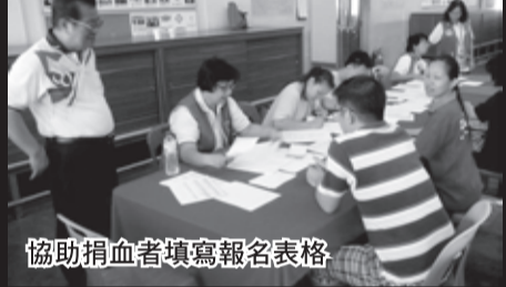
協助捐血者填寫報名表格