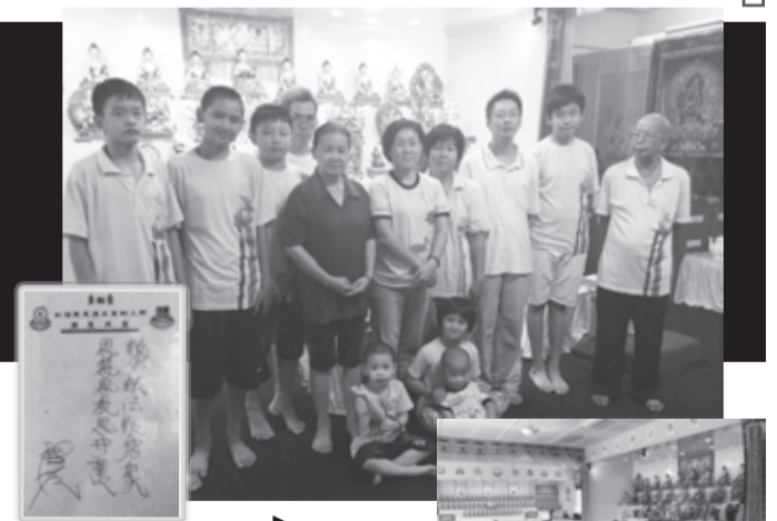
▶ 敬恩堂莊嚴的道場

歷經漫長的25年歲月，敬恩堂共搬遷了四次，如今依然是『借地修行』。弟子虔誠祈禱，祈願根本上師、佛菩薩諸尊，加持敬恩堂迅速成立新道場。