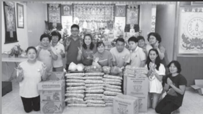
法會後，同修會也籌備了各種食糧往老人院及孤兒院發送

次要就是慈悲。修行人應該要保有慈悲心，要能包容大家的缺點與過失。師尊曾經開示八風法門，其中包括了(1)稱 (2)譏 (3)毀 (4)譽 (5)衰 (6)利 (7)