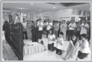
▶ 上師為新皈依同門做皈依灌頂