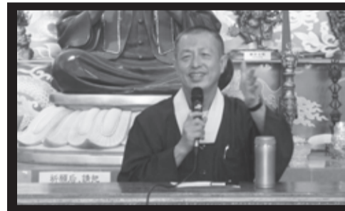
蓮花程祖金剛上師

首先，秘書先登記為戶口使用者，以電郵啟動戶口，登入密碼必須記錄(密碼需特定的，要有字母，號碼及符號，例如boleh@2014)。登入後，需填寫秘書和佛堂資料。呈交佛堂資料後，五至七天後就被接受成為社團秘書。接著，在六十天之內要呈交理事表及財務報告，其中包含會員大會會議日期和出席人數。過後，需確定章程。章程除了包含以上幾點之外，需加上緊急會議日期。在繳付了十令吉，待二十至四十天後等待章程批准通過後，社團註冊財務管理人，須付十令吉領取Borang 9B。接下來，下屆會員大會開始重覆第一和第二個步驟。第二年的理事會開始，理事如兩屆選舉無需更換理事表，只需要更新財務報告。第三年開始，如果秘書繼任，只須更新理事表及財務報告。若秘書不繼任，則需重新登記新秘書(步驟則需重新來過)。