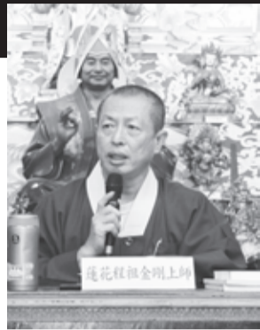
蓮花教主金剛上師