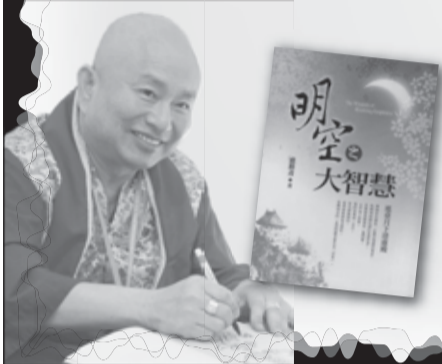
盧勝彥文集115冊 《明空之大智慧》 瑤臺月下清虛殿。