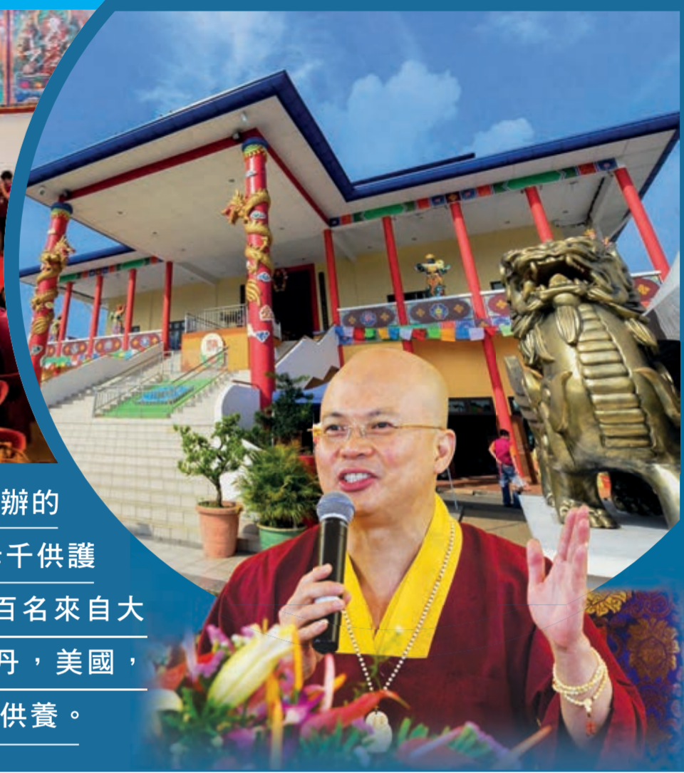
第3屆供僧大會來自海內外的僧眾

由馬來西亞真佛宗密教總會主辦，法輪雷藏寺協辦的「第三屆請佛住世全國供僧大會」暨「佛頂尊勝佛母千供護摩大法會」於砂拉越古晉法輪雷藏寺盛大舉行。近百名來自大馬，泰國，新加坡，印尼，汶萊，台灣，香港，不丹，美國，荷蘭，及加拿大的僧伽，雲集法輪雷藏寺，齊齊接受供養。