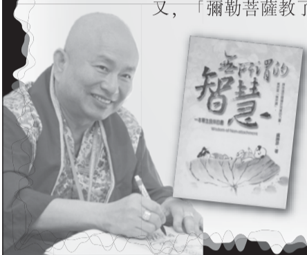
盧勝彥文集190冊《無所謂的智慧》原來這世間臻於完美的力量，竟然是「無所謂」。