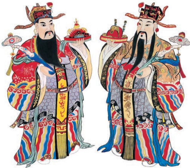
束縛，必要時甚至可以放棄所有的財富及榮華富貴，也使他因此成為民間信仰中，最有氣度的財

根據《封神演義》的記載，比干是殷商紂王的三大忠臣之一，紂王寵妾妲己以用人心的藥引子為藉口，殺死比干。姜子牙封神時，認為比干「無心」，自然沒有私心，因此封他做了財神。范蠡則是幫助越王勾踐中興復國，後來退隱到齊國陶地，開始經商，沒有多少年，變成了巨富，人稱「陶朱公」。范蠡能聚財，又不被財所