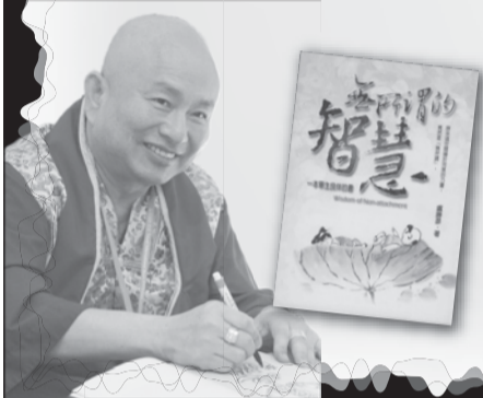
盧勝彥文集190冊《無所謂的智慧》原來這世間臻於完美的力量，竟然是「無所謂」。