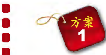
精緻琉璃堅牢地神