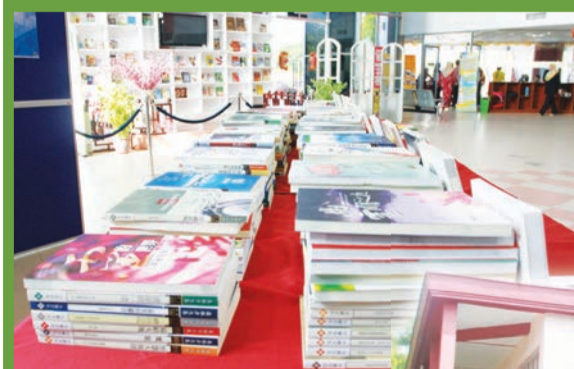
▲所捐獻的蓮生活佛文集