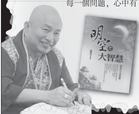
盧勝彥文集115冊 《明空之大智慧》 瑤臺月下清虛殿。