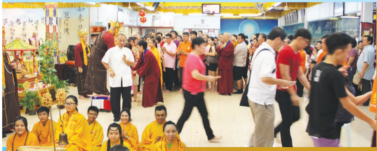
▲馬密總青年團團員