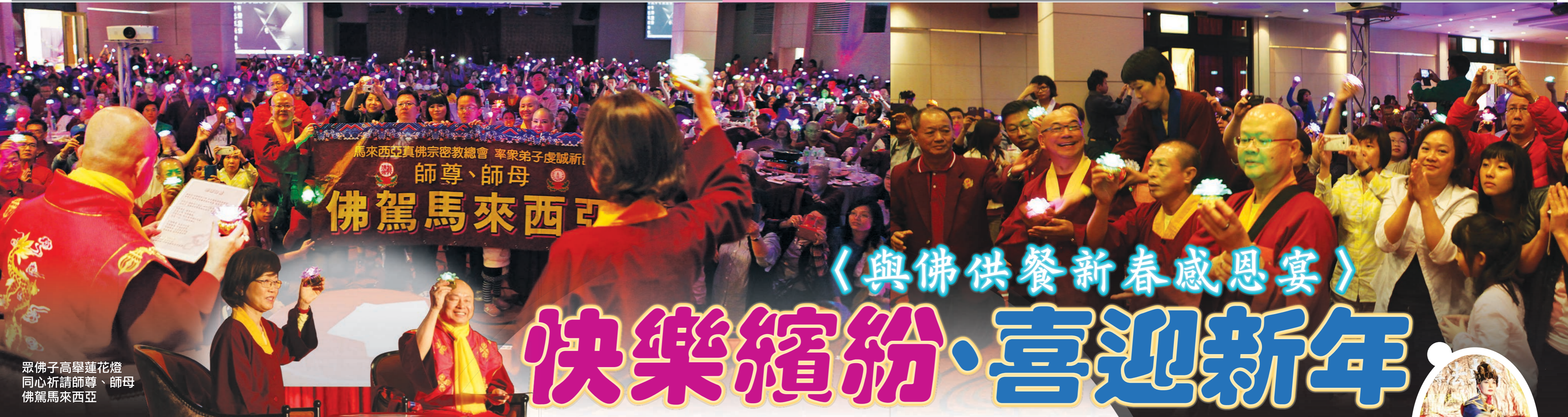
眾佛子高舉蓮花燈 同心祈請師尊、師母 佛駕馬來西亞