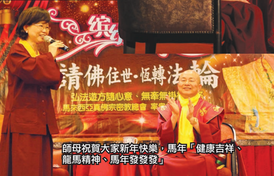
師母祝賀大家新年快樂，馬年「健康吉祥、龍馬精神、馬年發發發」

午夜尾聲由蓮花程祖金剛上師代表大眾向師尊敬獻哈達、法王袍及法王冠後，師尊亦慈悲——為與會眾等摸頂加持。最後，雖然眾弟子們縱有千萬個不捨，在無限依依難捨的心情中，無奈與師尊、師母道別，恭送師尊、師母離開宴會的會場。