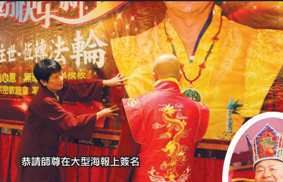
恭請師尊在大型海報上簽名