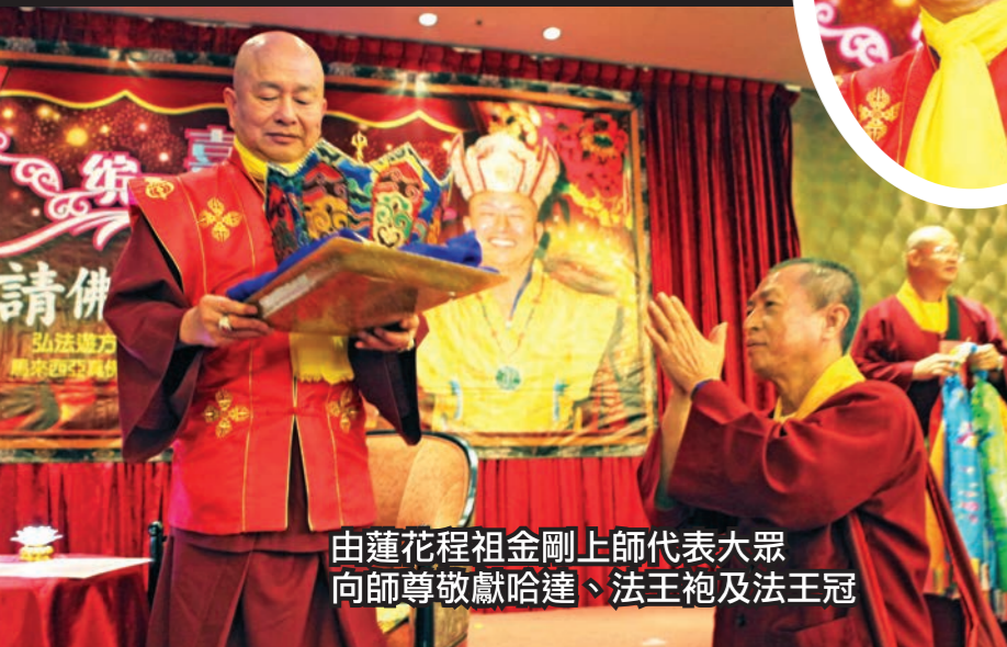
由蓮花程祖金剛上師代表大眾向師尊敬獻哈達、法王袍及法王冠