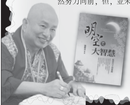
盧勝彥文集115冊 《明空之大智慧》 瑤臺月下清虛殿。