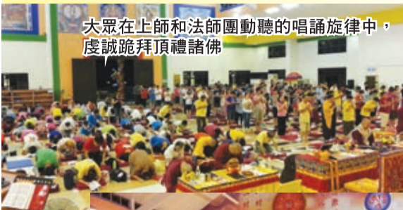
大眾在上師和法師團動聽的唱誦旋律中，虔誠跪拜頂禮諸佛