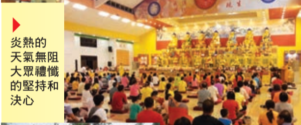
炎熱的天氣無阻大眾禮懺的堅持和決心