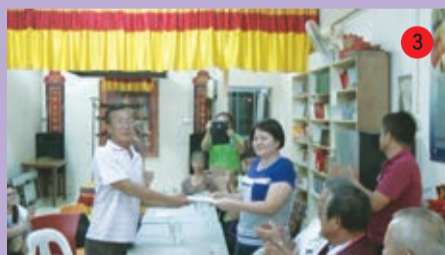
見證 ①主席 ②秘書 ③財政 委任移交儀式