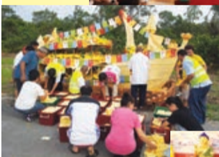
清明節超度大法船