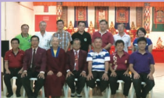
新、舊理事會與馬密總代表公關組合照