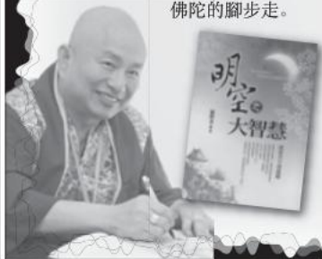
盧勝彥文集115冊 《明空之大智慧》 瑤臺月下清虛殿。

就是這些稀有的「教化」，使我著上法衣，發菩提心，守清淨的戒律，實修真如的佛法，行無「執著」行。我的信心非常的堅固，時時跟著佛陀的腳步走。