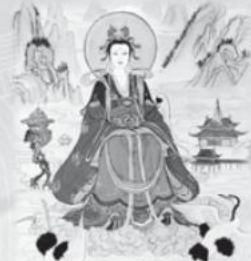
南摩慈願福池金母大天尊