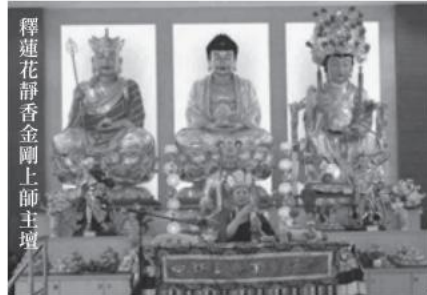
釋蓮花靜香金剛上師主壇