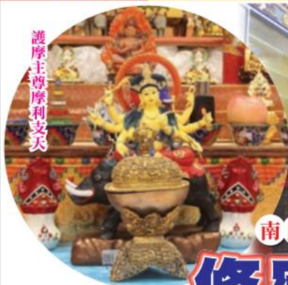
護摩主尊摩利支天