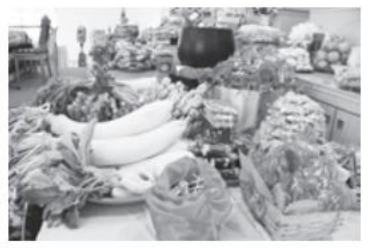
▲ 紅財神護摩法會供品