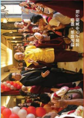
眾弟子心中萬般不舍

看著一群不分年齡的英眉站上舞台，期待中的一鏡終於來臨，師尊隨著燈光揮灑唱起，呈現一場精彩的舞蹈表演，抹殺了不少攝影機的身，會場貴賓們爭相躍往台前，高舉手機，照相機等以期留下師母片刻的身影。歌舞結束，讓人驚喜之外，師尊也上台表演金剛杵，讓全場的弟子們同時高舉頌佛【新請師尊、師母佛駕馬來西亞】，希望從此觸動師尊、師母的心。