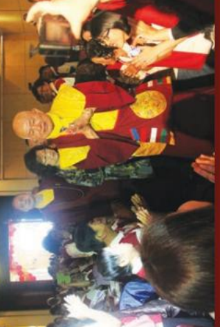
眾弟子跪迎師佛、師母的到来

就達了一年，又到了與師尊、師母共餐的時刻。有別以往的是，此屆感恩午宴共有一千多人參與共餐，是馬密總主辦歷來最盛會出席人數最為多的一屆。2015年3月6日中午，在根本上師佛駕前，會場響起眾人樂出互相的讚美頌歌，這得歸功於一名熱心的能克勤因因大的克拉克斯管理總會，呈獻一首首耳熟能詳的經典樂曲，展現現場精心奉養師尊、師母慈恩的貴客們。