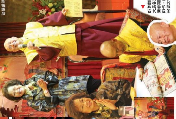
師佛翻閱大馬各道場于新春期間向師佛、師母祝賀之特刊