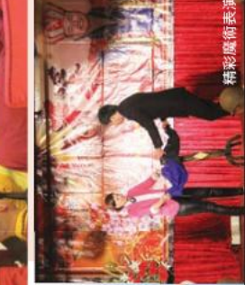
充滿朝氣的師母與陽光舞團的成員