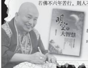
盧勝彥文集115冊 《明空之大智慧》 瑤臺月下清虛殿。

我主張「自然而然」最好。我不是苦行主義，也不是享樂主義，我不要人人都「非常行法」，我認為「非常行法」與「常行法」均是可行的。