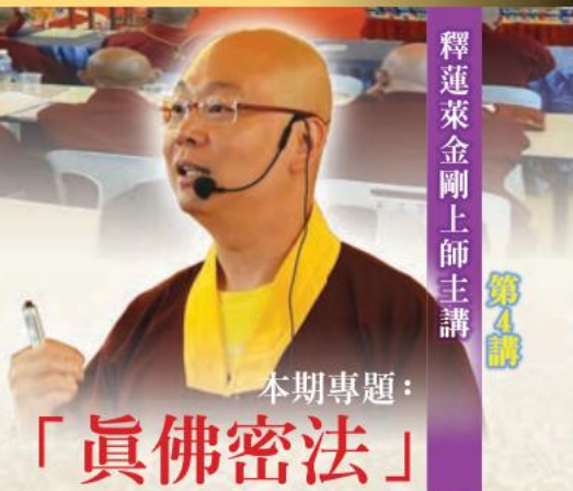
釋蓮萊金剛上師主講