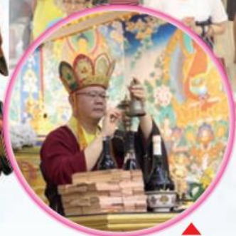
主壇釋蓮太金剛上師