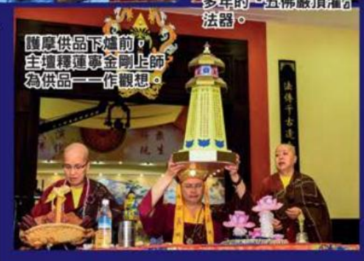
護摩供品下爐前，主壇釋蓮寧金剛上師為供品一一作觀想。