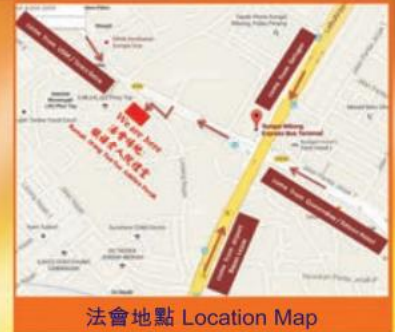
法會地點 Location Map

信徒參與法會, 通過禮拜諸佛, 可以獲得無上利益。釋迦牟尼佛也曾親口宣說, 過去、現在、未來三千佛洪名, 為苦海大舟航, 火宅甘露王。若眾生誠心念佛一聲, 增福無量: 「禮佛一拜, 罪滅河沙」