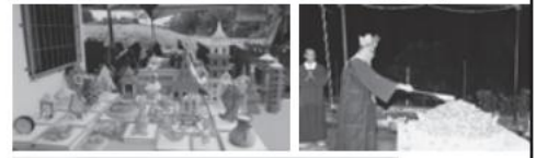
填土工程 安慧雷藏寺