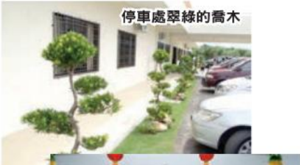
停車處翠綠的喬木