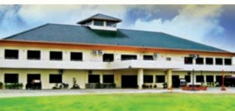
雄偉壯觀的馬密總“平和養老院”