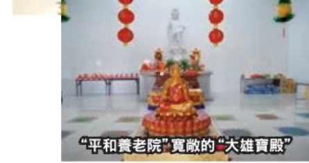
“平和養老院”寬敞的“大雄寶殿”