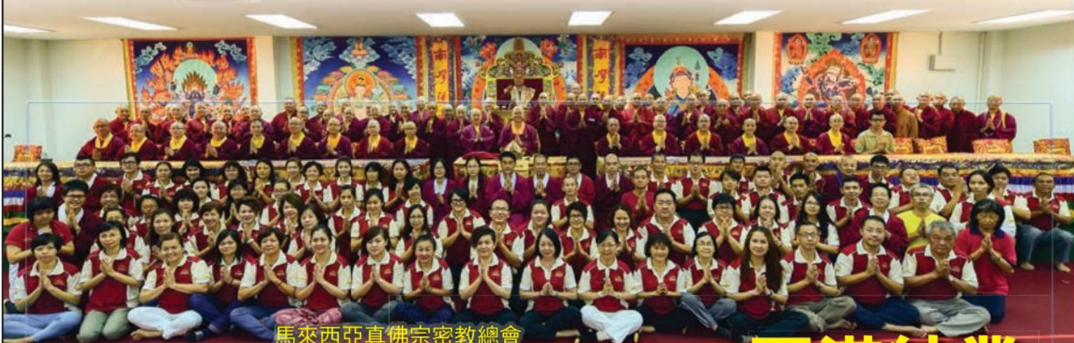
馬來西亞真佛宗密教總會