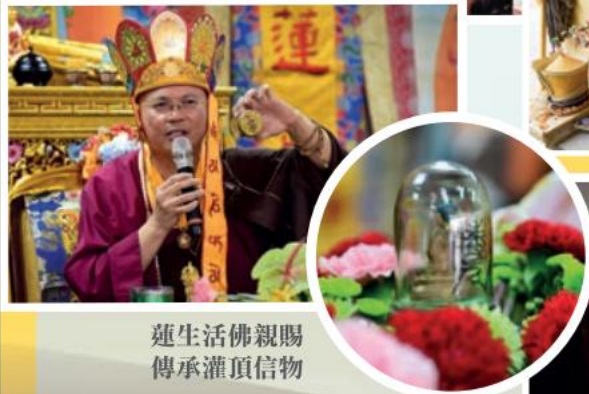
蓮生活佛親賜 傳承灌頂信物