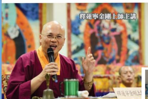
釋蓮寧金剛上師主講