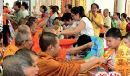
善信一心虔誠獻供