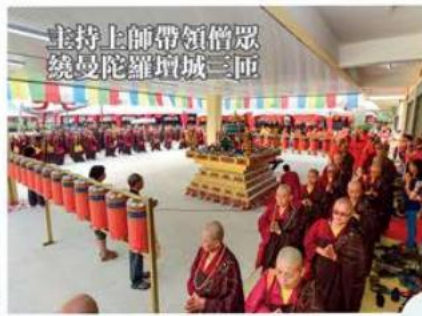
主持上師帶領僧眾繞曼陀羅壇城三匝

2015年10月18日，萬眾期待的大馬真佛宗年度盛事——「第四屆請佛住世全國供僧大會」暨「釋迦牟尼佛藏密火供大法會」於霹靂州務邊區平和養老院圓滿舉行。此屆全國供僧大會很榮幸再次邀請到來自大馬、泰國、新加坡、印尼、汶萊、台灣、香港、不丹、美國、荷蘭及加拿大的正師團、法師團及宗外的小乘僧伽蒞臨受供，讓此屆全國供僧大會備受矚目。