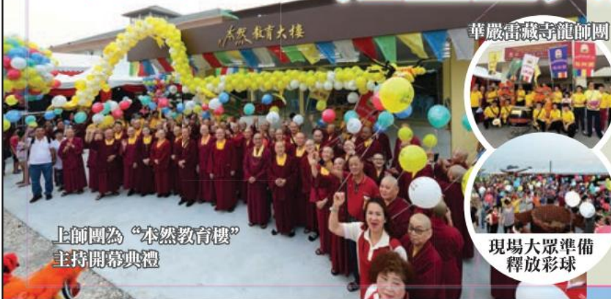
上師團為“本然教育樓”主持開幕典禮