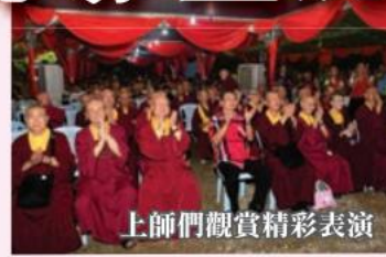
上師們觀賞精彩表演