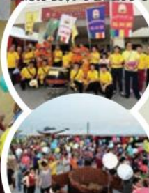
現場大眾準備釋放彩球

10月17日，全國供僧大會前夕亦是親善之夜當天，馬來西亞真佛宗密教總會首座規模宏偉的大德“本然教育樓”，在釋蓮寧金剛上師與眾多位來自國內外金剛上師的見證下盛大開幕，馬密總亦邀請來自柔佛州華嚴雷藏寺的龍師團助陣。