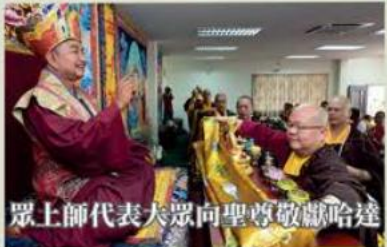
眾上師代表大眾向聖尊敬獻哈達

依去年慣例，今年的供僧儀式以獻哈達為主，以表最崇高敬意。大眾同門排隊敬獻哈達給個別僧眾，以代表供養所有的僧寶。與會大眾在大會的指示下，魚貫入場，虔誠的向聖尊根本傳承上師蓮生活佛，住世羅漢賓頭願尊者及在座每一位僧伽獻上最恭敬的供養。供養僧伽儀式後，釋蓮寧金剛上師為與會