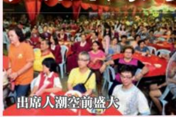
出席人潮空前盛大