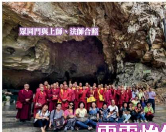
眾同門與上師、法師合照

霹靂洞內屋壁上有壁畫百餘幅，畫有十八羅漢及唐三藏西天取經圖等。另有佛像四十多尊，造型優美，形像萬千。內洞鐘乳石