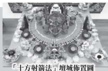
「十方射箭法」壇城佈置圖

都能得到最強敬愛和合的力量！將來想要當領袖，當總統，當國王的，修「咕嚕咕咧佛母法」祂能夠攝召所有的眾生來信服你，來推崇你，來選舉你，來擁護你，「咕嚕咕咧佛母」是具有大權威佛母。