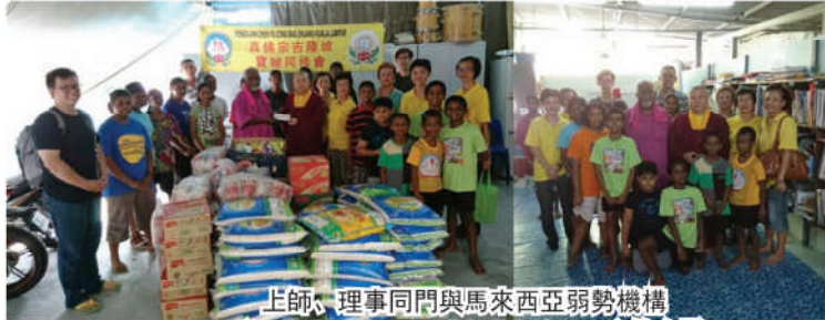
上師、理事同門與馬來西亞弱勢機構 (Stepping Stones Living Centre) 的合影