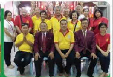
6月28日,公關組列席安順堂會員大會後,與眾會員合影