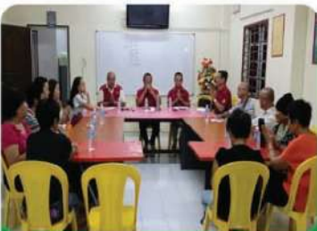
5月30日,晚上8.30pm 直涼傳印堂理事會與公關組交流會