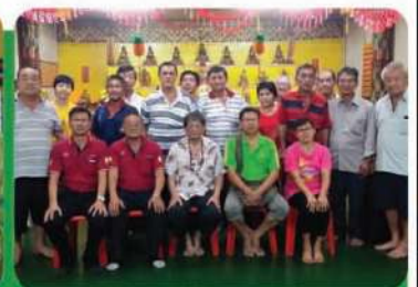
6月29日,公關組主持太平妙明同修會,會員大會選舉後與眾會員合影