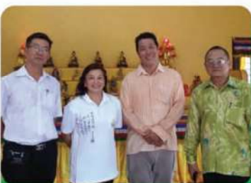
6月28日,太平十八丁善化同修會主席夫婦熱心借出自己農家地段作為道場用途