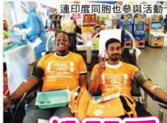
連印度同胞也參與活動