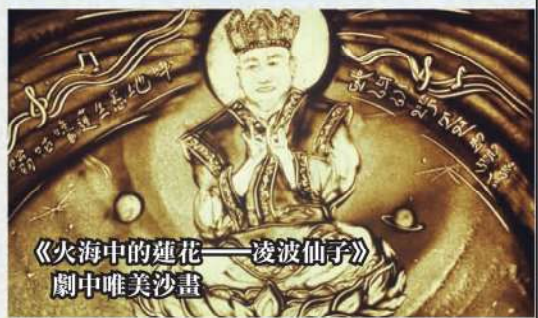
《火海中的蓮花——凌波仙子》劇中唯美沙畫