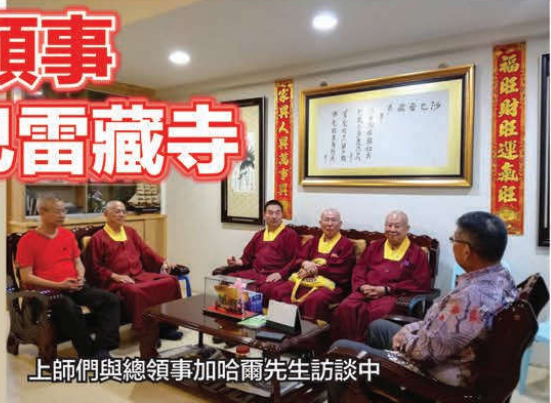
上師們與總領事加哈爾先生訪談中

真佛宗沙巴雷藏寺舉辦一連七天「南摩六道觀音菩薩息災祈福解冤超度護摩大法會」。在第六天法會(5月29日晚上)有貴賓來自於印尼駐砂朥越州總領事加哈爾(Jahar Gultom)參訪真佛宗沙巴雷藏寺,由沙巴雷藏寺住持釋蓮禪金剛上師歡迎接待參訪沙巴雷藏寺,本寺住持一一詳細的解釋。