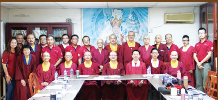
馬來西亞真佛宗密教總會 第六屆中央理事會第十五次會議 於2017年5月7日（星期日）下午1時 假般若雷藏寺會議室圓滿舉行。