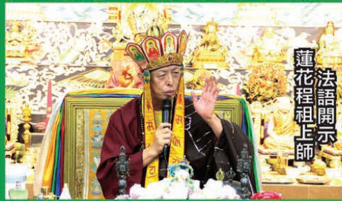
蓮花程祖上師法語開示