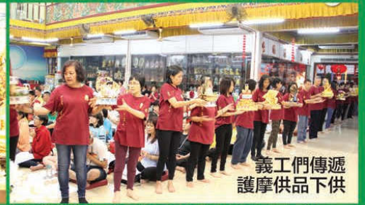
義工們傳遞護摩供品下供