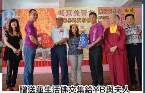
贈送蓮生活佛文集給YB與夫人